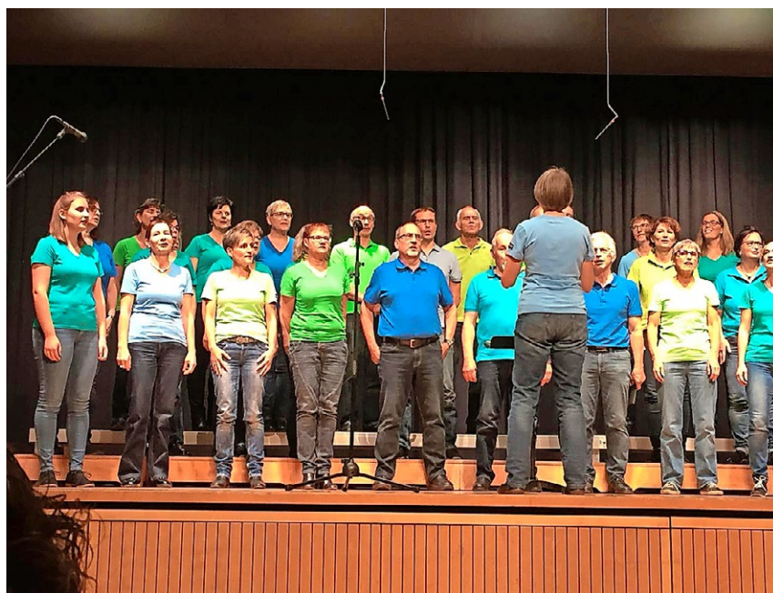
Die Sängerinnen und Sänger suchen Verstärkung.

Über neue Sängerinnen und Sänger würde sich der Chor sehr freuen.